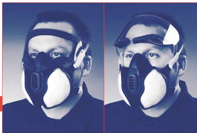
3M™ 125 visiera protettiva